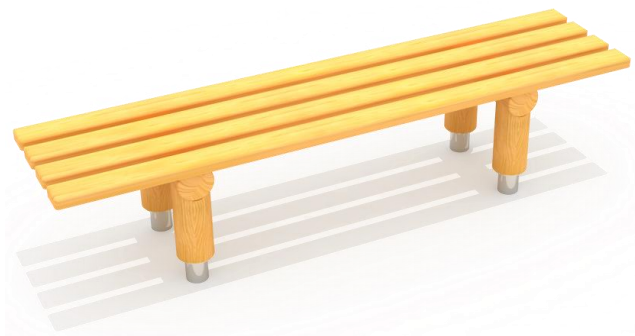
ŁAWKA PROSTA - GT-0047