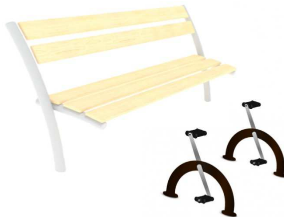
Widok ławki przykładowej

Wszystkie wymiary podano z dokładnością do 5 cm.